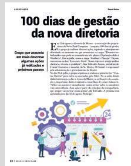
Edição 83 Jul Ago 2021 – Gestão detalha ações em andamento