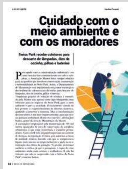
Edição 71 Jul Ago 2019 – Investimento para o meio ambiente