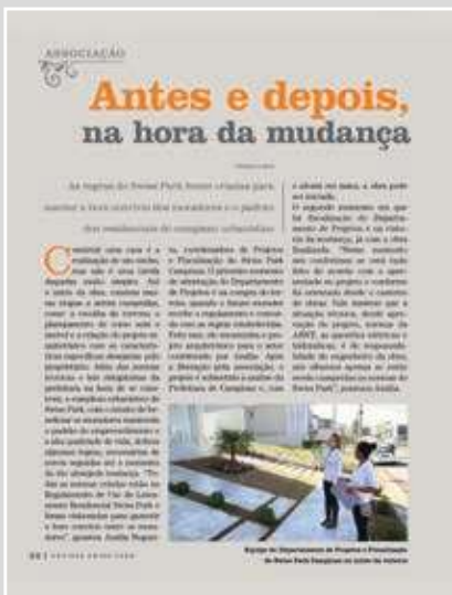
Edição 41 Jul Ago 2014 – Orientações para mudanças

aqui algumas publicações em edições passadas, como forma de nossa gratidão a todos que respondem pela diretoria atual e pelas diretorias que já estiveram à frente da Master. Nossas páginas estão à disposição!