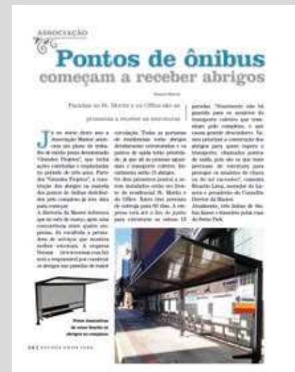
Edição 57 Mar Abr 2017 – Primeiros abrigos nos pontos de ônibus