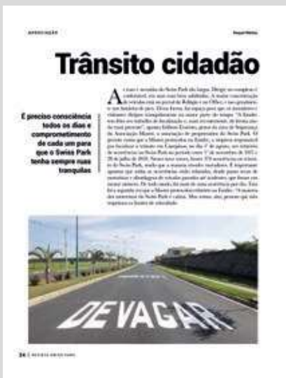
Edição 65 Jul Ago 2018 – Foco no trânsito do complexo