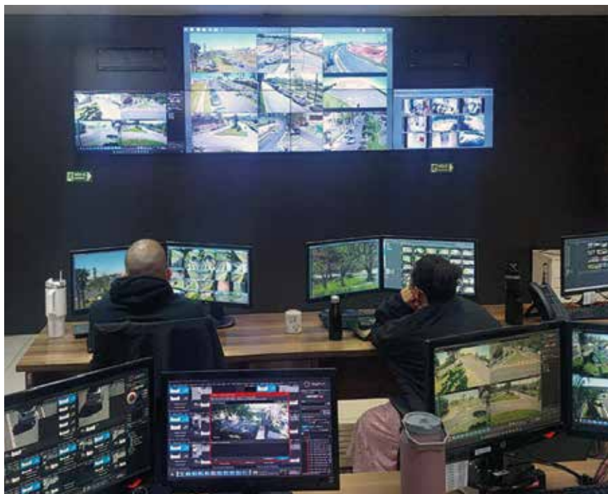
Segurança: Central de Monitoramento da Master, Associação dos Proprietários Swiss Park Campinas

A Master também tem desempenhado um excelente trabalho na manutenção e conservação do complexo, cuidando da limpeza, iluminação, poda estética e preventiva, corte de grama e iluminação de Natal. Essas ações demonstram um compromisso sólido com a melhoria contínua e a conformidade legal, garantindo um ambiente seguro e bem administrado para todos os associados.